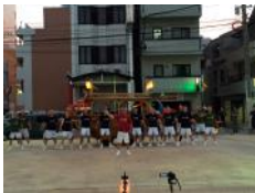
中央公園 9/1, 2, 12, 16, 17