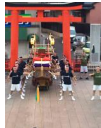
卍 八坂神社 9/5, 8, 19

入場や退場の方向が違ったり、場所の石畳の状態が違うので、それぞれ場所に合わせた船のセンター決め、走り廻し方がある。それを確認しながら、練習をしていく。九月十九日、八坂神社の最終練習日まで、二十三日間の練習は一日も無駄にはできない。