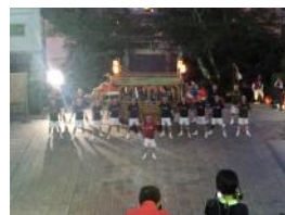
卍 諏訪神社 9/6, 7